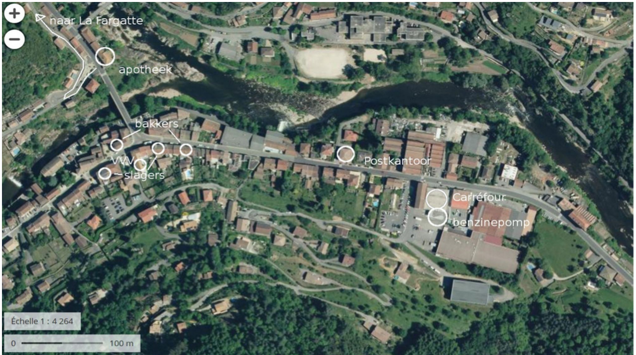
Luchtfoto St Sauveur de Montagut met lokatie van winkels, etc.